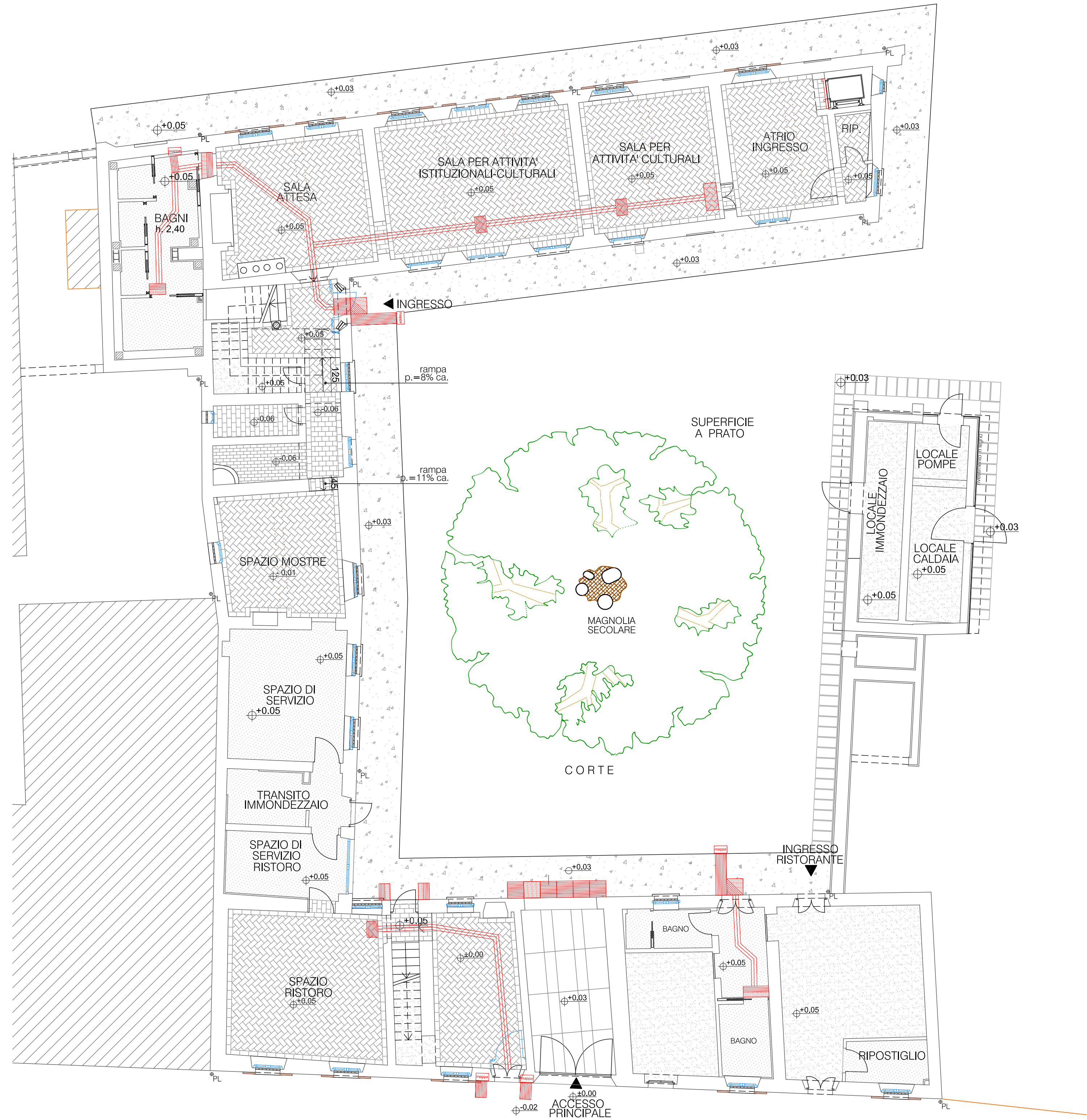
PIANTA SUPERAMENTO BARRIERE PER IPOVEDENTI